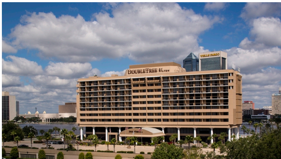
The DoubleTree by Hilton Jacksonville Riverfront

Der DDG-5-Crew-Mitgliedsverband Reunion 2018 segelte am Sonntag, 6. Mai 2018, über den Horizont. Es war eine tolle Zeit mit viel Kameradschaft unter den Schiffbrüchigen und ihren Frauen. Wie schon 2016 war der DoubleTree von Hilton Jacksonville Riverfront unser Hostel-Hotel und wieder einmal waren das Hotel und seine Mitarbeiter außergewöhnlich.